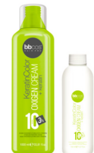
ОКИСЛИТЕЛЬ «KERATIN COLOR» 3%, 6%, 9%, 12% Арт. KOX - 1000 мл Арт. KOXP - 150 мл