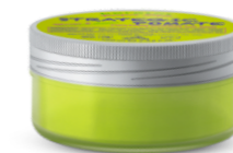
МОДЕЛИРУЮЩАЯ ПАСТА ДЛЯ ВОЛОС Арт. KWAX - 100 мл