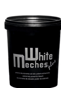
ОСВЕТЛЯЮЩАЯ ПУДРА Арт. WMP - 500 гр Арт. WMPB - 20 гр