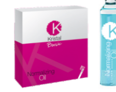
НОРМАЛИЗУЮЩЕЕ МАСЛО ДЛЯ ВОЛОС Арт. BNO - 12 ампул по 10 мл