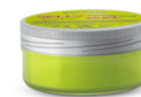
ГЕЛЬ ДЛЯ СТИЛИЗАЦИИ ВОЛОС Арт. KGJ - 100 мл