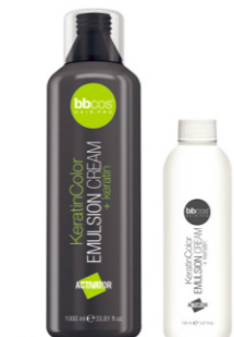
КРЕМ-ЭМУЛЬСИЯ «KERATIN COLOR» 1,5% Арт. ECK - 1000 мл Арт. ECKP - 150 мл