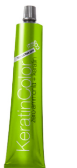
СТОЙКАЯ КРЕМ-КРАСКА «KERATIN COLOR» 100 мл