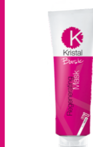
ВОССТАНАВЛИВАЮЩАЯ МАСКА ДЛЯ ВОЛОС Арт. BRM1-1500 мл Арт. BRM - 400 мл