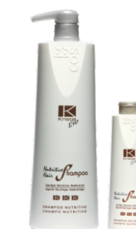
ПИТАТЕЛЬНЫЙ ШАМПУНЬ ДЛЯ ВОЛОС Арт. ESN1-1000 мл Арт. ESN - 300 мл