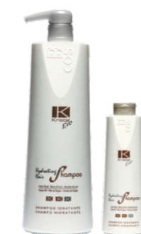
УВЛАЖНЯЮЩИЙ ШАМПУНЬ ДЛЯ ВОЛОС Арт. ESI1 - 1000 мл Арт. ESI - 300 мл