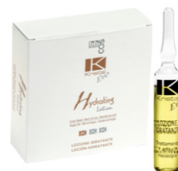
УВЛАЖНЯЮЩИЙ ЛОСЬОН ДЛЯ ВОЛОС Арт. ELJ - 12 ампул по 10 мл