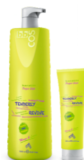
ВОССТАНАВЛИВАЮЩИЙ КРЕМ-КОНДИЦИОНЕР Арт. KTR1 - 1000 мл Арт. KTR - 250 мл