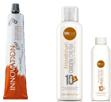
СТОЙКАЯ КРЕМ-КРАСКА ДЛЯ ВОЛОС «INNOVATION EVO» 100 мл