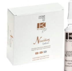
ПИТАТЕЛЬНЫЙ ЛОСЬОН ДЛЯ ВОЛОС Арт. ELN - 12 ампул по 10 мл