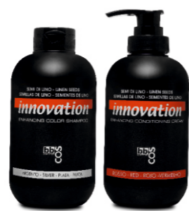
ШАМПУНЬ И МАСКА «ОБНОВЛЕНИЕ ЦВЕТА» (серебристый, блонд, каштановый, красный) 250 мл