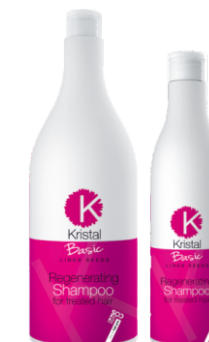
ШАМПУНЬ ВОССТАНАВЛИВАЮЩИЙ Арт. BRS - 500 мл BRS1 - 1500 мл Арт. BRS5-5 л BRS10-10 л