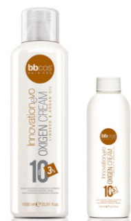
ОКИСЛИТЕЛЬ «INNOVATION EVO» 3%, 6%, 9%, 12% Арт. OXE - 1000 мл Арт. OXP - 150 мл