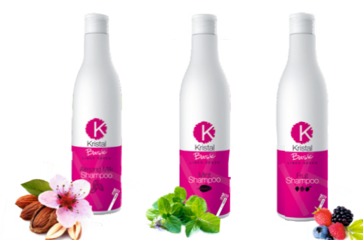
ШАМПУНЬ ДЛЯ ВОЛОС - С МИНДАЛЬНЫМ МОЛОЧКОМ - С ПЕРЕЧНОЙ МЯТОЙ - ФРУКТОВЫЙ 500 мл, 1500 мл, 5 л, 10 л