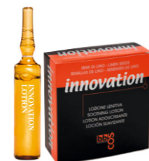
СМЯГЧАЮЩИЙ ЛОСЬОН Арт. ILL 12 ампул по 10 мл