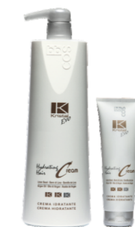
УВЛАЖНЯЮЩИЙ КРЕМ ДЛЯ ВОЛОС Арт. ECIV-1000 мл Арт. ECIT - 250 мл