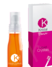
СРЕДСТВО КОСМЕТИЧЕСКОЕ «ЖИДКИЕ КРИСТАЛЛЫ» Арт. BLCR - 50 мл