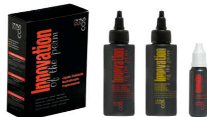
НАБОР СРЕДСТВ «БИО-ЗАВИВКА» Арт. IP - 100 мл + 80 мл + 20 мл