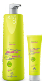
ШАМПУНЬ ДЛЯ ОБЪЕМА ВОЛОС Арт. KBS1-1000 мл Арт. KBS - 250 мл