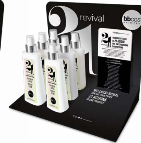
ESPOSITORE DA BANCO 21 in 1 da 250 ml