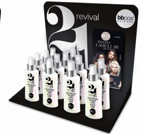
ESPOSITORE DA BANCO 21 in 1 da 100 ml