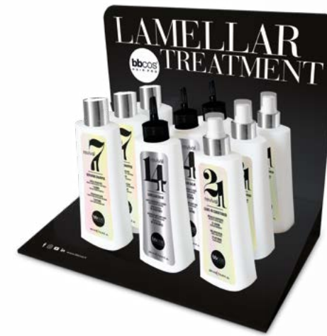
ESPOSITORE DA BANCO trattamento lamellare